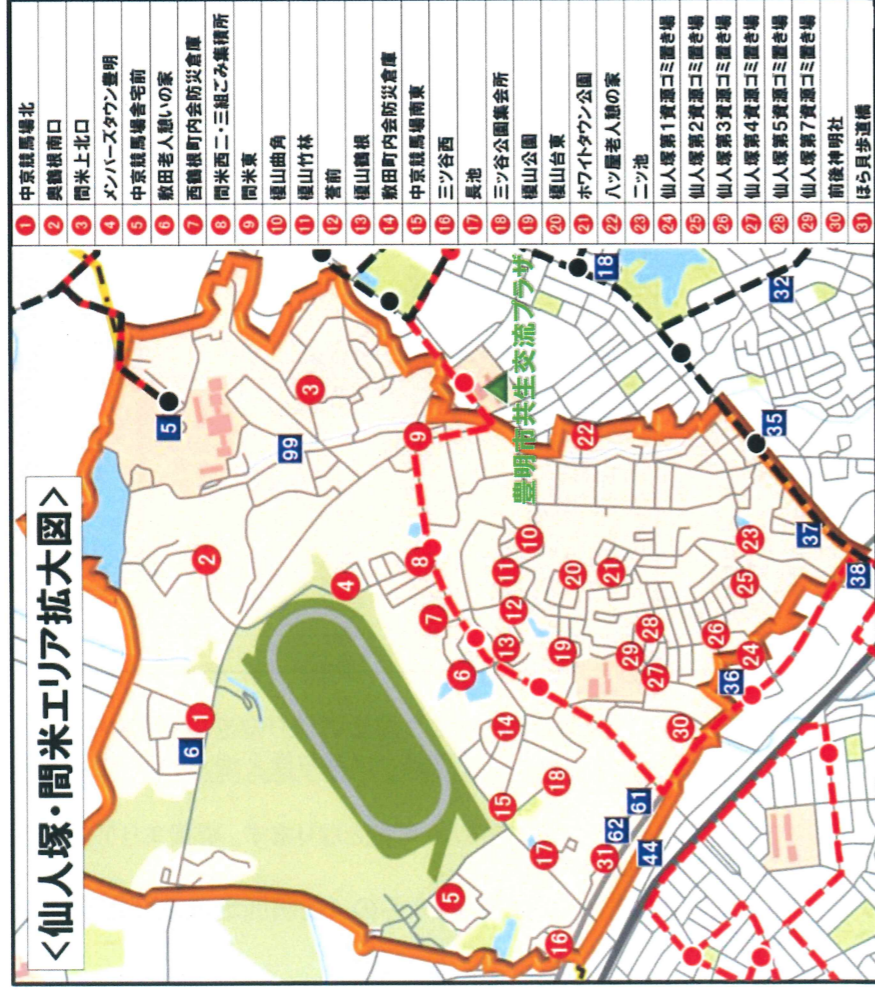
＜仙人塚・間米エリア拡大図＞